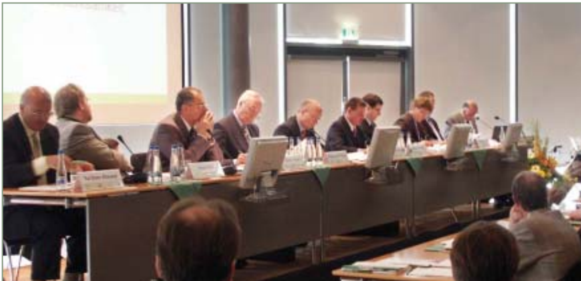
> Aufsichtsrat und Vorstand der init innovation in traffic systems AG.

Nach erfolgreich vollzogenem Turnaround werden neue Geschäftsimpulse erwartet.