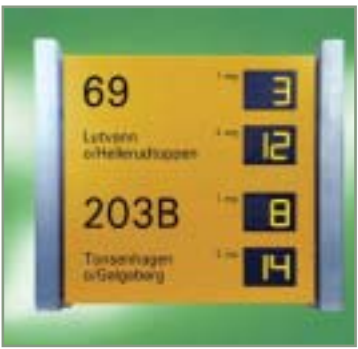
> Pro Anzeigenmodul können zwei Abfahrtszeiten angezeigt werden. Die Abbildung zeigt zwei Module.

Das modulare Konzept der PIDIntegral besteht aus einer Kommunikationseinheit und separaten Anzei-