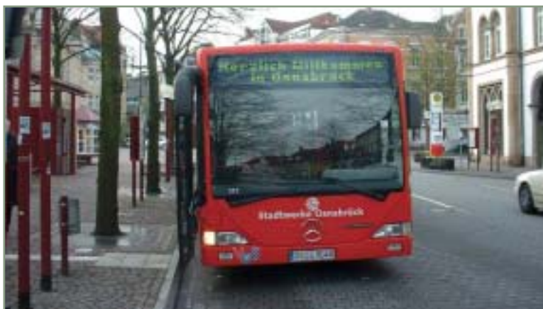
> Freundliche Begrüßung der Teilnehmer des "INIT Workshops Java-RBL" auch auf dem Bus zur Leitstelle der Stadtwerke Osnabrück.

Ferner erfuhren die Zuhörer wie ein erfolgreiches Migrationskonzept zur Umstellung eines bestehenden RBL auf ein Java-RBL aussieht. Die Erfahrungen von INIT aus den bisher erfolgreich realisierten Projekten haben die Bedeutung einer guten Vorbereitung im INIT-Labor in