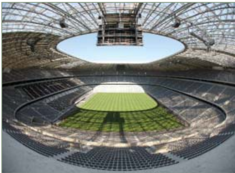
> Die Allianz Arena, das neu erbaute Fußballstadion in München. 52.000 Menschen werden beim Eröffnungsspiel der Fußballweltmeisterschaft 2006 dabei sein.

> Vielfältige und umfassende Informationsdarstellungen erleichtern