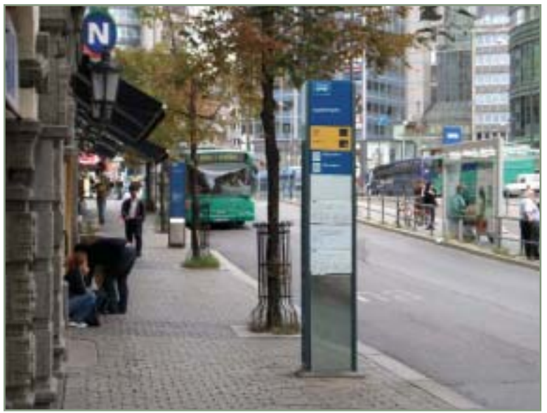
> Gut informiert sind Fahrgäste künftig auch an Haltestellen, an denen es aus wirtschaftlichen Gründen bisher noch keine Echtzeit-Informationen gab.

geeinheiten. Jede Anzeigeeinheit besteht aus zwei 7-Segmentdisplays. Durch diese Modularität ist es leicht möglich, bestehende Haltestellen und -schilder mit den Anzeigenmodulen auszurüsten. Die flexible Einbaumöglichkeit ist neben den günstigen Beschaffungskosten der große Vorteil dieser INIT-Neuentwicklung.