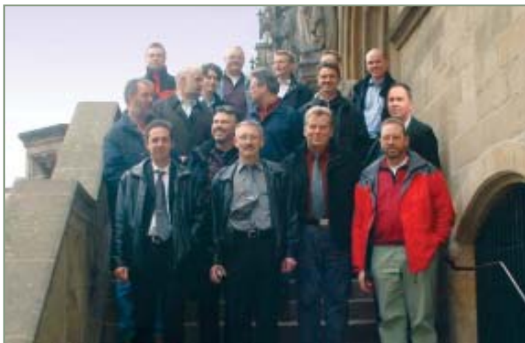
> Während der Altstadtführung stellten sich die Teilnehmer vor dem Osnabrücker Rathaus zum Gruppenfoto auf.

Dass die Friedensstadt Osnabrück nicht nur ein innovatives öffentliches Nahverkehrssystem vorweisen kann, sondern darüber hinaus einiges zu bieten hat, wurde im Rahmenprogramm dieser Anwendertagung deutlich: Die Altstadtführung