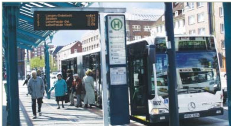
> Die Bremerhavener wissen immer „was geht“. Das dynamische Fahrgastinformationssystem zeigt Wirkung in Bremerhavens Innenstadt und erhöht die Attraktivität des Öffentlichen Personennahverkehrs.

Im Technikraum der VGB am Hauptbahnhof befindet sich ein Anzeigensteuerrechner, der über Standleitung an das RBL-Netzwerk angebunden ist und mit dem zentralen FGI-Rechner kommuniziert. Die Ansteuerung erfolgt über eine socketbasierte Schnittstelle, die auf TCP/IP als offene und standardi-