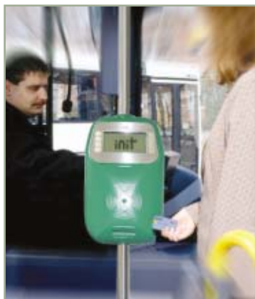
> TICKETcheck: die kombinierte Kontrolleinheit für Magnet- und Chipkarten verkürzt die Einstiegszeiten und entlastet die Fahrer.

Klaus Janke Tel. +49.721.6100.119 kjanke@init-ka.de