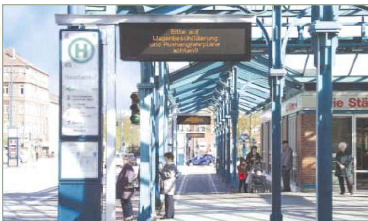
> Bei Störungen können dank im Mastfuß eingebauter Revisionsklappen Wartungsarbeiten unkompliziert vor Ort von einer Person durchgeführt werden.

Der Einsatz der Funktechnik zur Ansteuerung der Anzeigen ersparte im Vergleich zur Verlegung von Erdkabeln erhebliche Kosten, was der VGB jetzt Zug um Zug die Erweiterung ihrer dynamischen Fahrgastinformation ermöglicht. Künftig wird dieser moderne und fahrgastfreundliche Service also auch an weiteren Haltestellen zu Verfügung stehen.