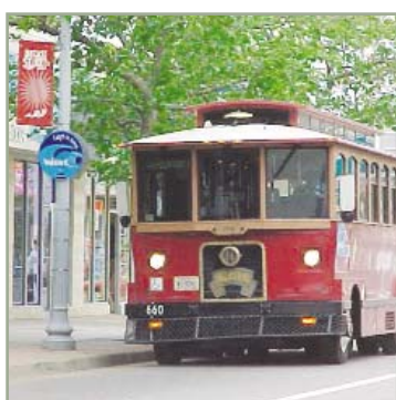
> Nostalgische Fahrzeuge ausgestattet mit modernster Technik. Da ist Ingenieurskunst gefragt.