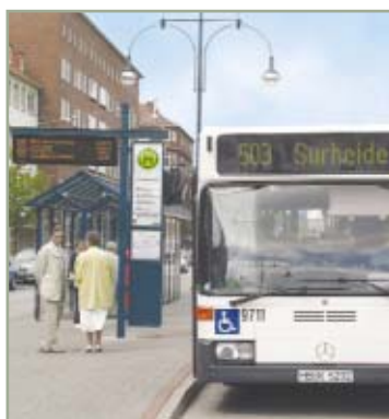
> Moderne Echtzeitfahrgastinformation über LED-Anzeige in der fußgängerfreundlichen Flanier- und Shoppingmeile Bremerhavens.

Nach erfolgreicher Inbetriebnahme entschloss sich die VGB das von den Kunden gut angenommene System mit weiteren Anzeigen im Innenstadtbereich auszubauen. Die Neugestaltung eines Teils der Innenstadt zu einer fußgängerfreundlichen und modernen Flanier- und Shoppingmeile bot dazu den Anlass. Um die Attraktivität des verkehrsbe-