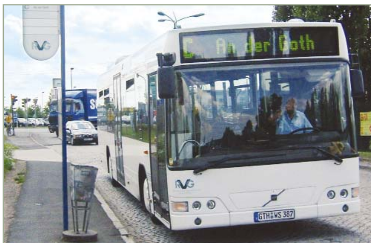
> Moderne Fahrzeugausrüstung steigert die Attraktivität und reduziert die Zugangshemmnisse für die Fahrgäste in Gotha.

> Ihr Ansprechpartner: Andreas Schmiede Tel. +49.30.6392.3644 aschmiede@init-ka.de