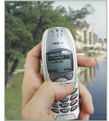
> Der Fahrgast hat die Wahl: Soll-Abfahrtszeiten laut Aushangfahrplan offline oder Abfahrtszeiten in Echtzeit online.

All diese Services kann der Anwender bequem über eine Menüführung nutzen. Vorkenntnisse sind zur Bedienung dieser intuitiven JAVA-Applikation nicht erforderlich. Somit bietet sie dem Fahrgast eine einfache, schnelle und kostengünstige Möglichkeit, sich wann und wo immer über die Abfahrtszeit seines Busses oder seiner Bahn zu informieren.