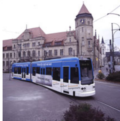
BOMBARDIER TRANSPORTATION Niederflurstraßenbahn von Bombardier Transportation für Dessau, Deutschland